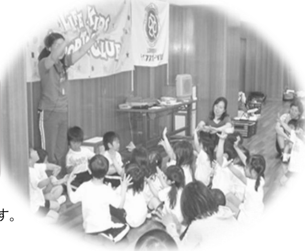
「ライフキッズスポーツクラブ」の様子