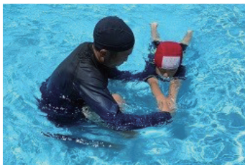
子どもの体力向上事業 (令和3年度 長野県伊那市)