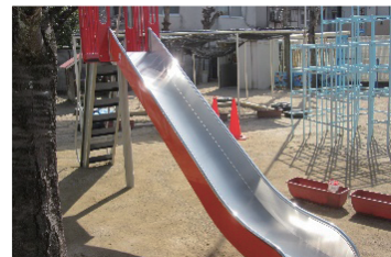
園庭遊具の設置 (令和2年度 京都府長岡京市)