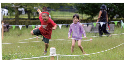
岐阜県山県市 小学生対象 「ワイルド ウォーター RUN」

ストレッチプログラム、ランニング・障害物・水鉄砲を使ったファンランニング、ウォーターガンバトルといった遊びの中で「走る・投げる・跳ぶ」の3要素を取り入れた運動体験イベントです。参加した子どもたちからは「友だちと思いきり遊べて楽しかった」など嬉しい声がたくさん上がりました。