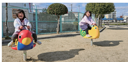
大阪府藤井寺市 道明寺京樋公園遊具設置・ 梅が園善徳保公園遊具設置事業

ストレッチプログラム、ランニング・障害物・水鉄砲を使ったファンランニング、ウォーターガンバトルといった遊びの中で「走る・投げる・跳ぶ」の3要素を取り入れた運動体験イベントです。参加した子どもたちからは「友だちと思いきり遊べて楽しかった」など嬉しい声がたくさん上がりました。