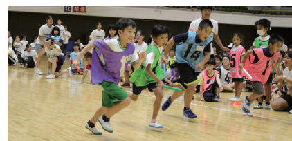
公益財団法人岐阜県スポーツ協会 子ども運動チャレンジ教室 ～運動が苦手な子、集まれ!!～

道明寺京樋公園に幼児用のリンク遊具および低鉄棒を新たに設置、梅が園善徳保公園では、老朽化が進んでいたリンク遊具をリニューアルしました。子どもたちが遊具を安心・安全に利用できるようになったとともに、遊具の種類が大幅に増えたことで子どもたちの遊ぶ機会が増えました。